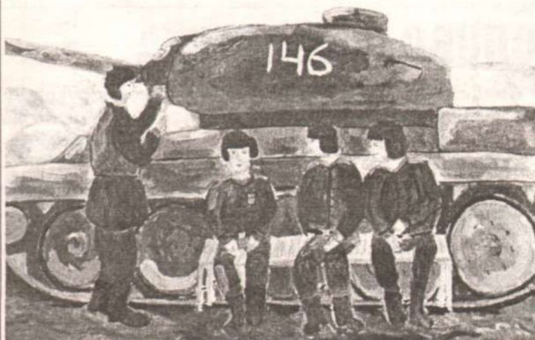
После боя. Тышко Ира.